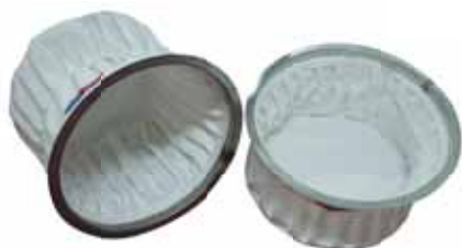
Filtro Zig-zag em Tecido Sarja ou Agulhado