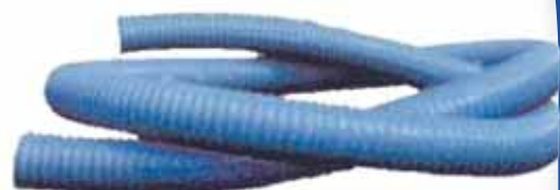
Mangueira flexível, rígida ou translúcida, em diversos diâmetros.