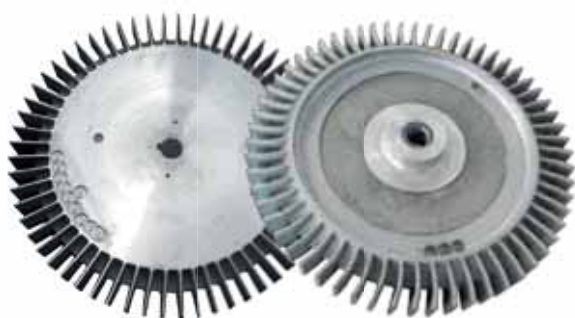
Rotor compressor antigo Rotor compressor atual