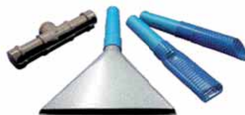
Bocal em PVC, bocal metálico triangular e bocal bico de pato