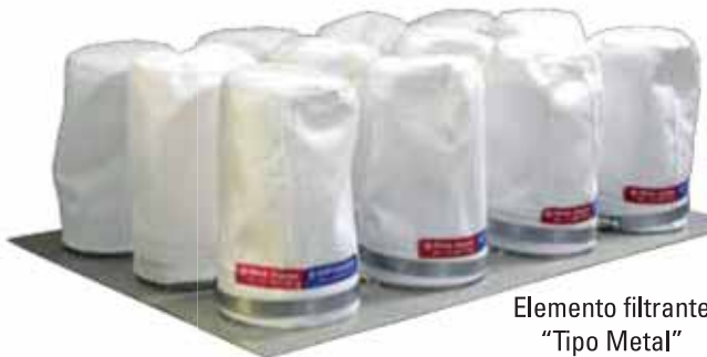
Elemento filtrante "Tipo Metal"