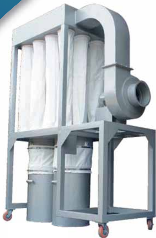
Modelo Taka - Tipo Peroba 100