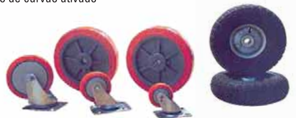
Rodas e rodízios