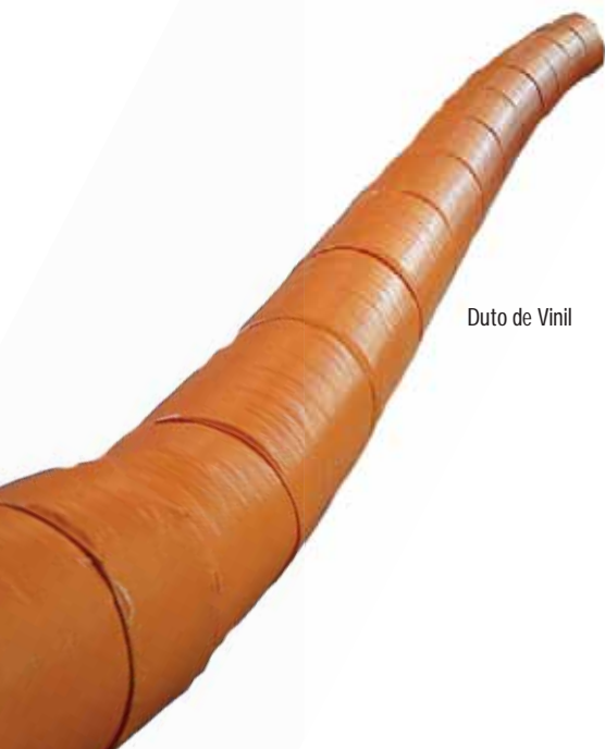
Duto de Vinil