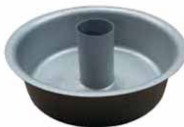
Depósito primário para aspirador