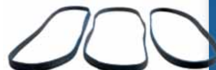
Guarnição de borracha p/ aspirador de pó