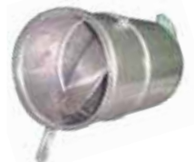
Damper em aço inox