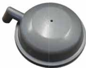
Tampa com ou sem batedor para vácuo ou aspirador

Obs.: Fornecemos acessórios, assistência técnica e reformas para equipamentos de outros fabricantes e para outros modelos de filtros.