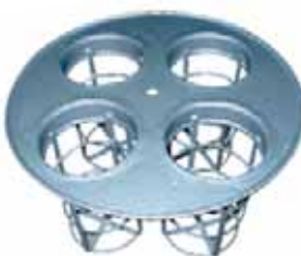
Cesto para 4 filtros modelo Vácuo