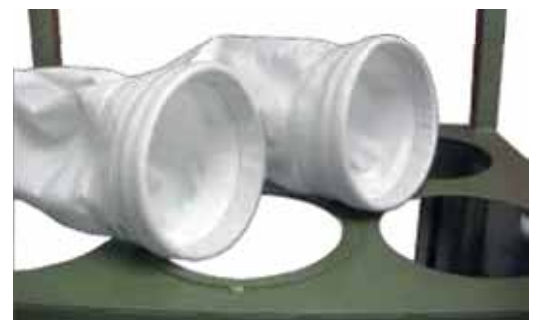
Filtros com sistema de encaixe rápido para coletor de pó: TAKA, HT, MAGO e TINA