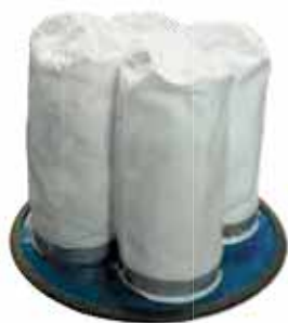
Kit completo para aspirador: Gaiolas - 4 filtros Vácuo - 70 / 77 / 80 NESS / NJ -V-75