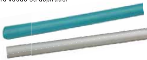
Tubo em P.V.C. e alumínio / 1,30 m