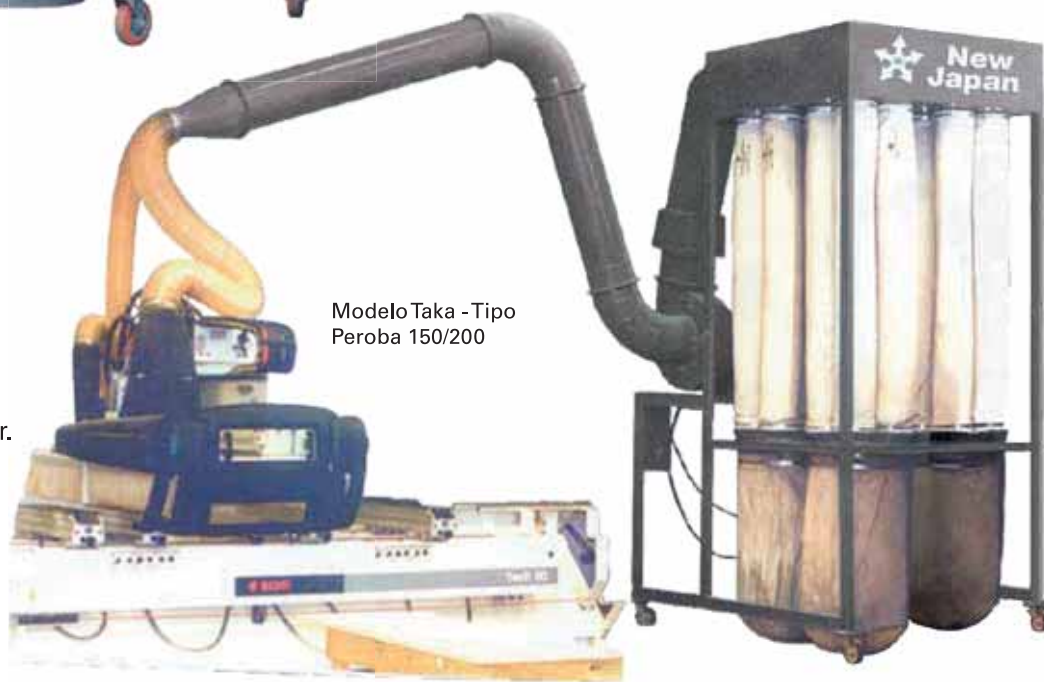
Modelo Taka - Tipo Peroba 150/200

Motor trifásico: Alto rendimento WEG - 2 Pólos, 60 Hz e proteção IP55.