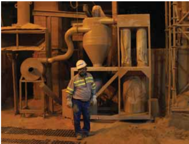
Paulo Mega 2 motores de 15,0 HP