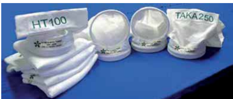
Filtros com sistema de encaixe rápido para coletor de pó: TAKA, HT, MAGO e TINA