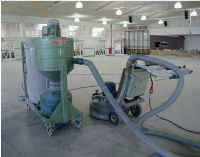
Aspirador de Pó Paulo