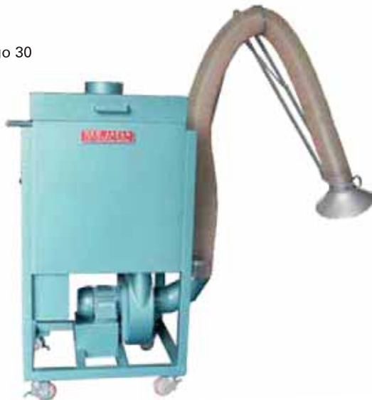
Mini Mago 30