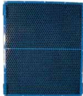
Filtro de carvão ativado